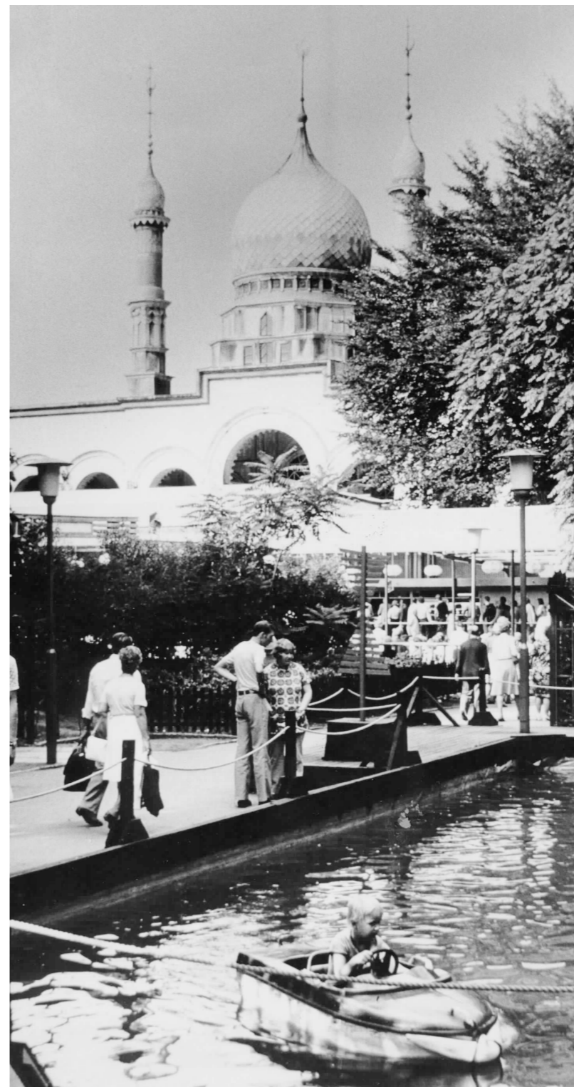
Glada besökare i Malmö Folkets Park, den första av sitt slag. Okänt datum.