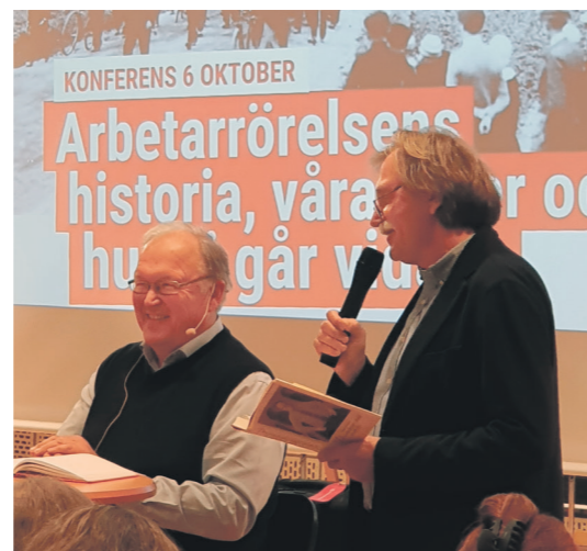
Före detta statsminister Göran Persson berättade om hur arbetarrörelsens idéer påverkat hans politiska gärning.