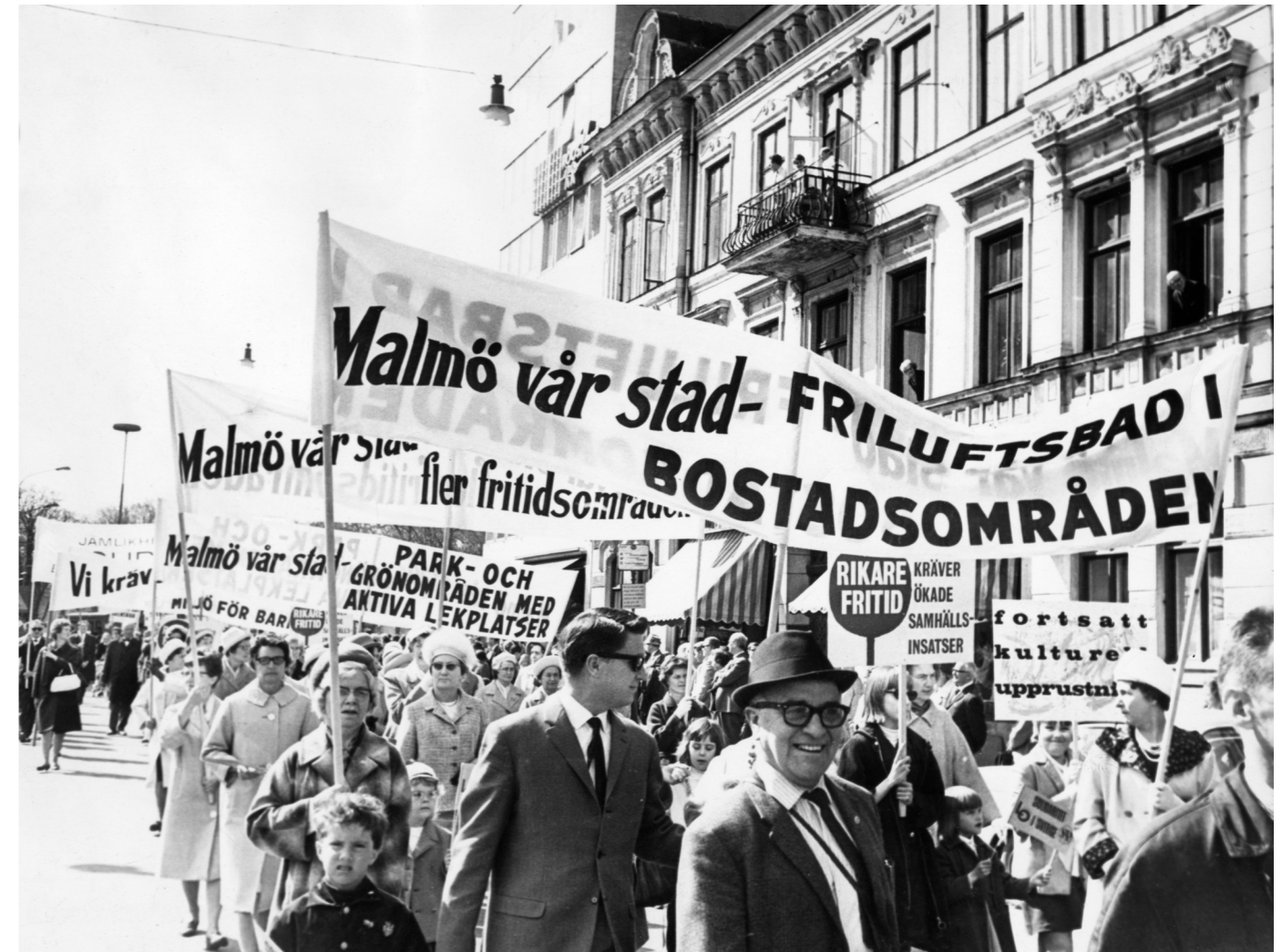
Arkivet bevarar och tillgängliggör arbetarrörelsens idéarv. På bild: demonstrationståg under firandet av första maj i Malmö 1966.

Arkivet har sedan några år tillbaka en ny policy att i större utsträckning agera pro-aktivt när det gäller insamlande av mer dagsaktuellt material. Inte minst vid arrangemang av mer tillfälliga former. När det gäller andra nätverk och föreningar än de traditionella, med framförallt yngre aktivister, är detta oftast enda sättet att kunna bevara något material från aktiviteten. Från Arkivets sida har vi i större utsträckning försökt nå ut och berätta om vad vi har för syfte med arkivet och att vi gärna hjälper dem att se till att spåren inte sopas igen efter deras ansträngningar. Med att sprida detta budskap vill vi gärna ha ytterligare hjälp av våra medlemmar. Ett arkiv måste hela tiden leva i samklang med sin samtid för att fortsätta vara relevant.