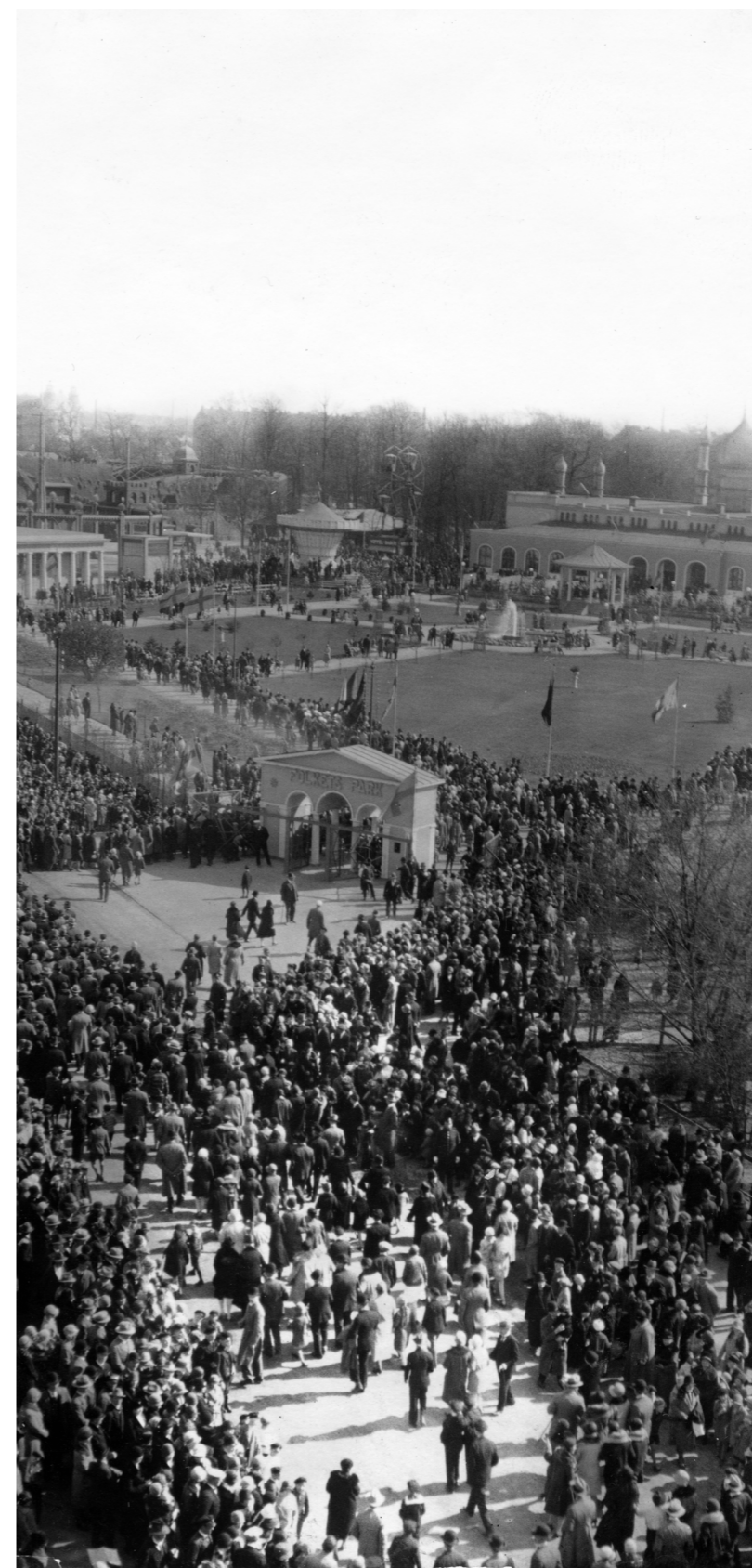
Tusentals demonstranter vid Malmö Folkets Park under firandet av första maj 1930.