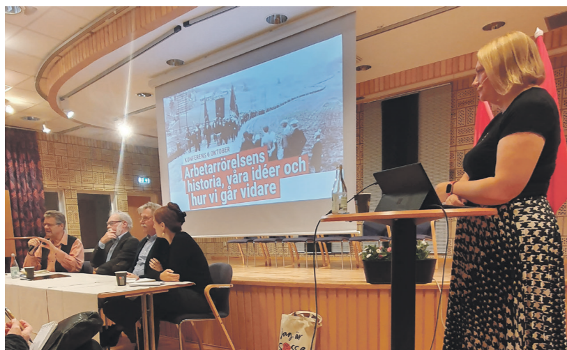
Nära 150 deltagare från 28 organisationer samlades på Backagården för att diskutera hur arbetarrörelsens historia kan användas idag