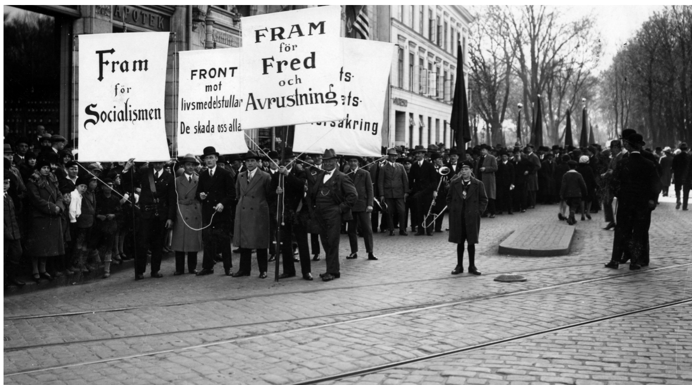
Arbetarrörelsen har alltid varit nära sammankopplad med idéer om internationell solidaritet och fred. På bild: demonstrationståg på väg från Gustav Adolfs torg i Malmö under firandet av första maj 1930.