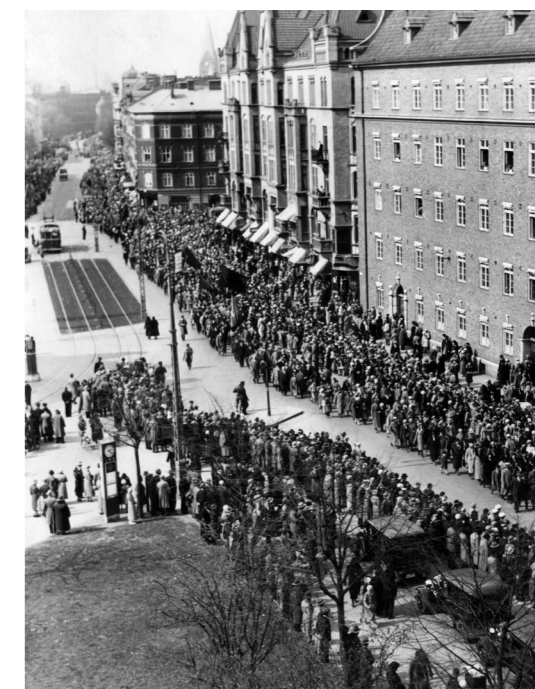
Amiralsgatan i Malmö under första maj-firandet 1930. Demonstranterna tågar mot Folkets Park.