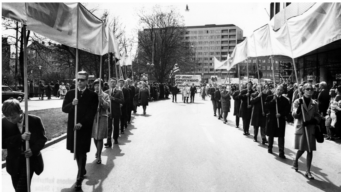
Demonstrationståg i Malmö mot Greklands militärdiktatur år 1967.