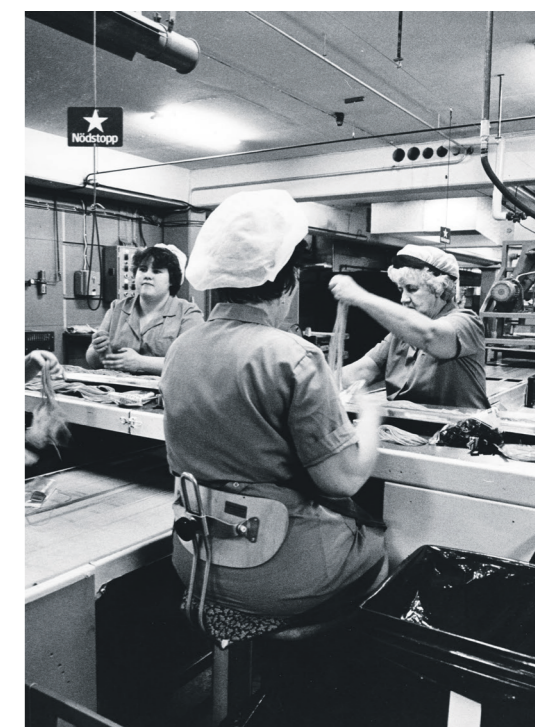
Arbetare vid löpande band under 1970-talet. Merparten av arkivets samlingar kommer från fackföreningar och den organisering som skett i människors vardag.